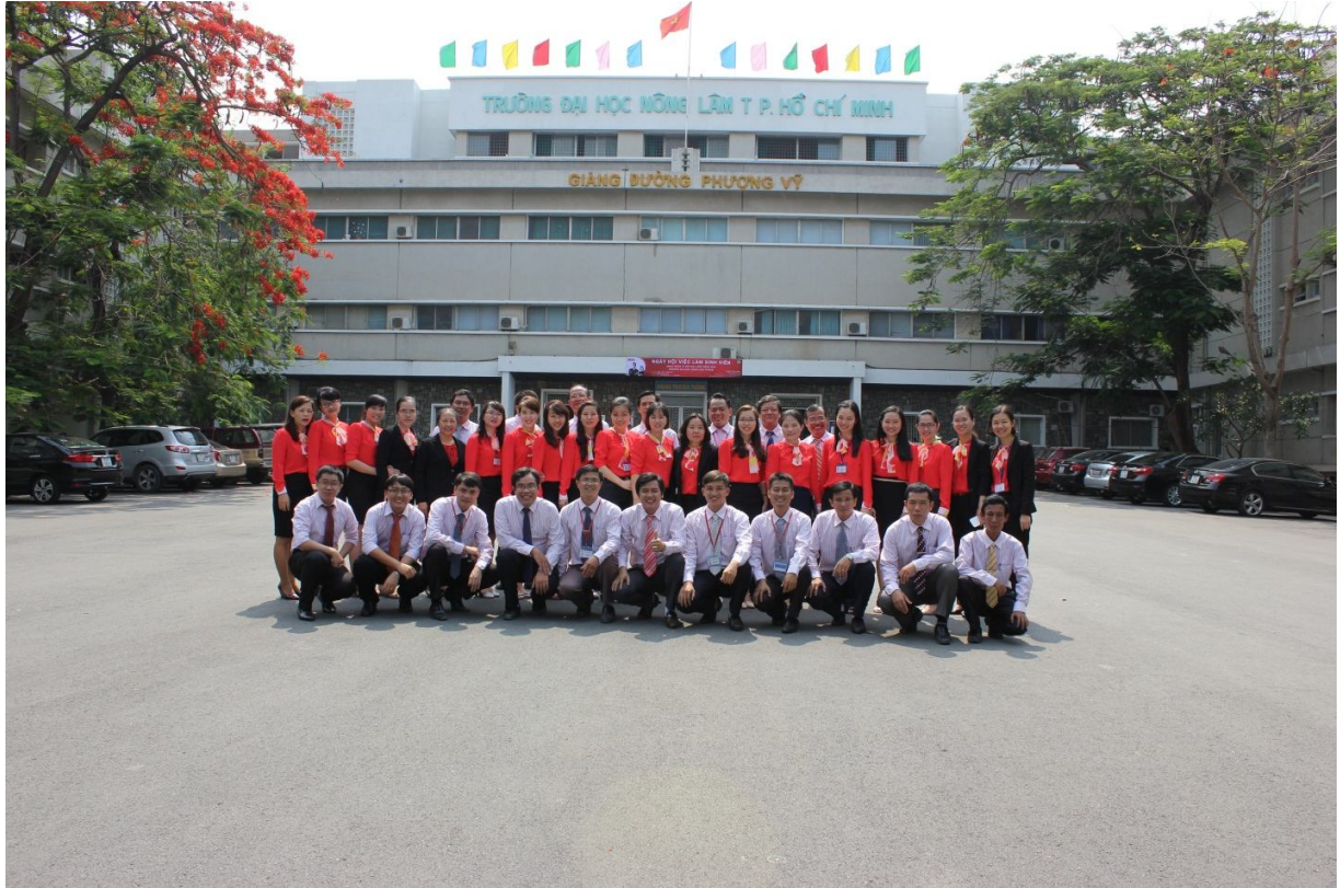
Giảng viên Khoa và bộ môn