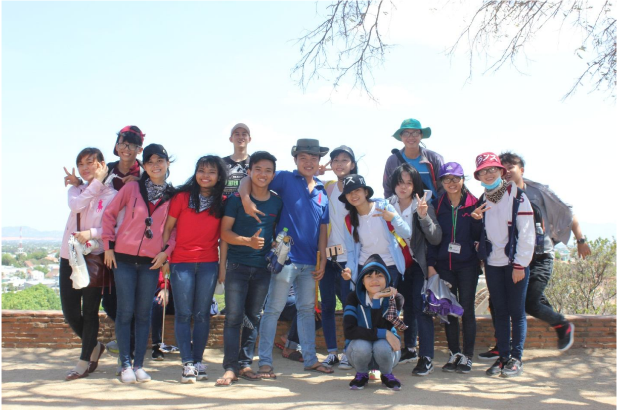
Thực tập sinh viên